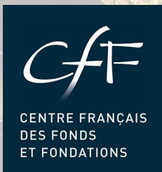
Table ronde Mardi 30 Mars 2021